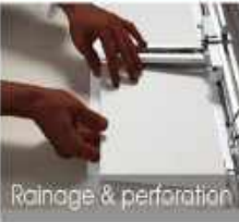
Rainage & perforation