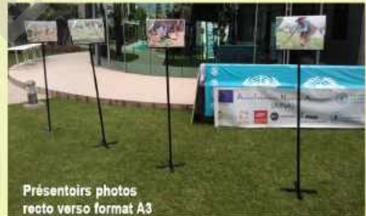
Présentoirs photos recto verso format A3