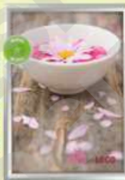
CADRE MURAL > AFM03

Cadre snapframe 23 mm de profil Coins serrés. Livré avec vis Affiche papier 105g Protection PVC anti-reflets Conditionnement unitaire Couleur : aluminium