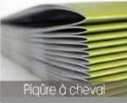
Piqûre à cheval