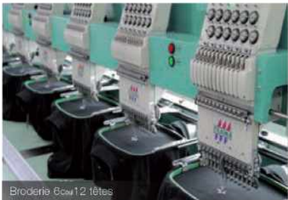
Broderie 6cm 12 têtes