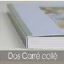
Dos Carré collé